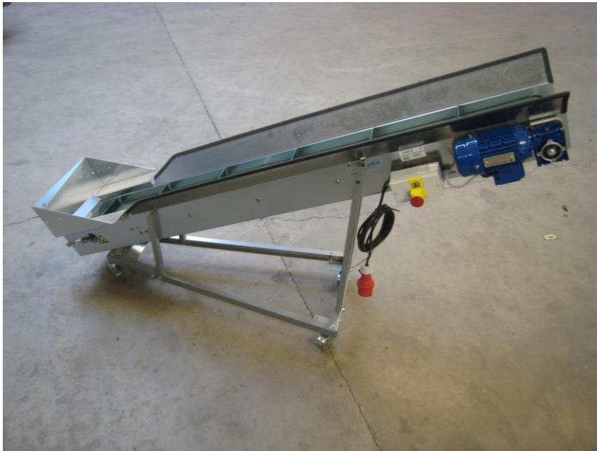
Zd. 2 Statyw do podajnika